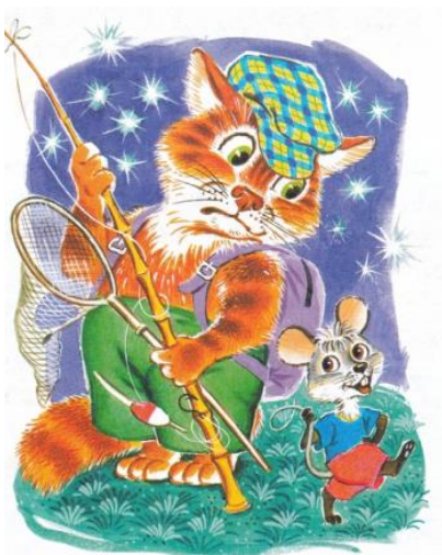
«Почему мыши котов не обижают»