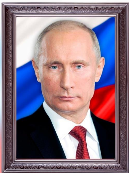
ПУТИН ВЛАДИМИР ВЛАДИМИРОВИЧ

Согласно Конституции главой государства Российской Федерации является Президент. В статье 80 Конституции РФ сказано, что Президент РФ является гарантом Конституции РФ, прав и свобод человека и гражданина. В установленном Конституцией РФ порядке он принимает меры по охране суверенитета РФ, ее независимости и государственной целостности, обеспечивает согласованное функционирование и взаимодействие органов государственной власти, определяет основные направления внутренней и внешней политики государства.