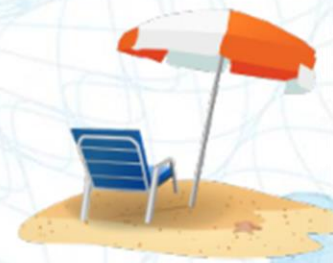
Не работать (финансовая независимость)