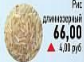
Рис длиннозерный 66,00 ▲ 4,00 руб

Масло «Богородское село» 180 гр. 105,00 ▼ 10,00 руб