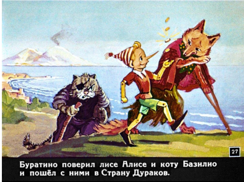
Буратино поверил лисе Алисе и коту Базилио и пошёл с ними в Страну Дураков.

Те, боясь напасть на него в открытую, сначала поели за счет Буратино в харчевне, а затем, переодевшись разбойниками, попытались завладеть его монетами. После погони и подвешивания Буратино на ветке дерева, Алиса и Базилио не смогли отобрать деньги у мальчика (он спрятал их в рот), после чего тот оказался у Мальвины.