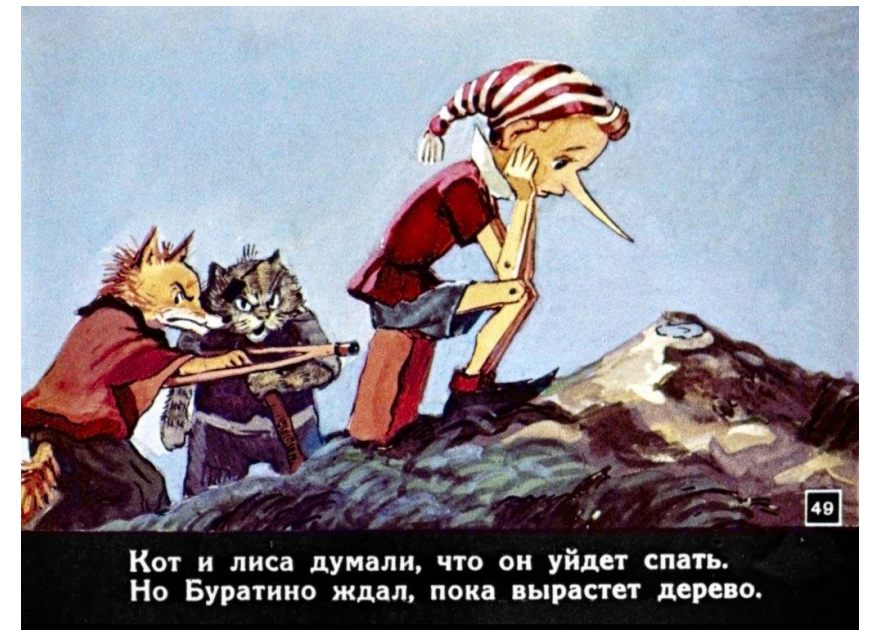
Кот и лиса думали, что он уйдет спать. Но Буратино ждал, пока вырастет дерево.

Лиса Алиса и кот Базилио, узнав, что у Буратино есть деньги, решили "развести" его и рассказали ему про Поле Чудес, находящееся в Стране Дураков. По их словам, если закопать на этом поле золотую монету, произнести волшебные слова и посыпать это место солью, то на следующий день из нее вырастет дерево с золотыми монетами вместо листьев.