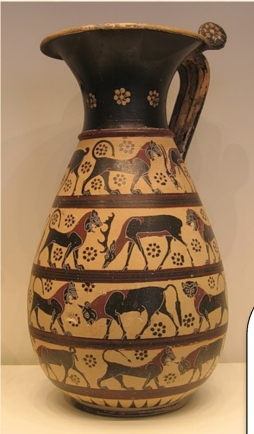
Сосуд из Коринфа