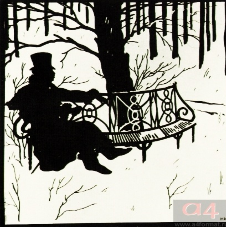
Пушкин в Царском Селе. Н.Ильин.