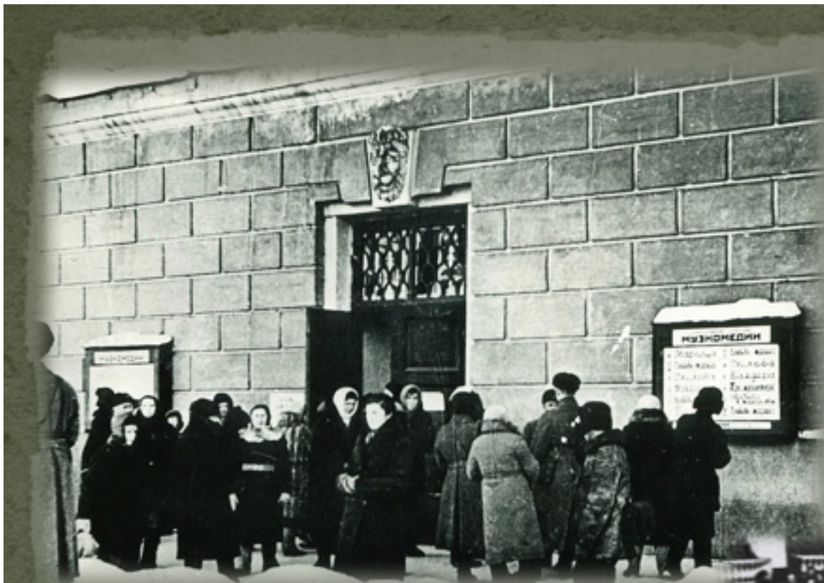
Очередь в театр Музкомедии