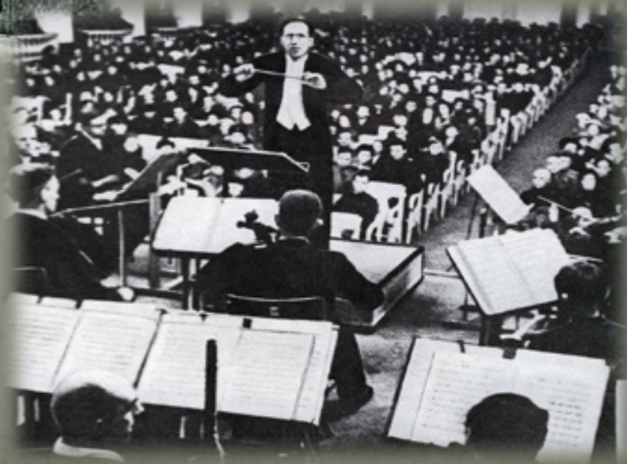
Исполнение «Ленинградской» Симфонии Д.Шостаковича