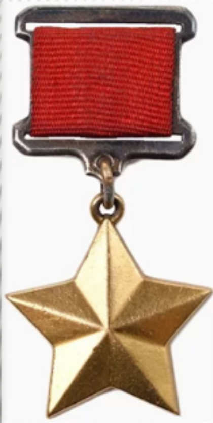
Медаль «Золотая Звезда».

Приказом Верховного Главнокомандующего от 1 мая 1945 года Ленинград вместе со Сталинградом, Севастополем и Одессой был назван городом-героем за героизм и мужество, проявленные жителями города во время блокады. 8 мая 1965 года Указом Президиума Верховного Совета СССР Город-герой Ленинград был награждён высшими наградами советского времени орденом Ленина и медалью «Золотая Звезда».