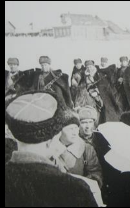
Велика Россия, а отступать некуда - позади Москва!

Для возобновления наступления на Москву Вермахт развернул 51 дивизию , в том числе 13 танковых и 7 моторизованных . По замыслу немецкого командования, группа армий «Центр» должна была разбить фланговые части обороны советских войск и окружить Москву.