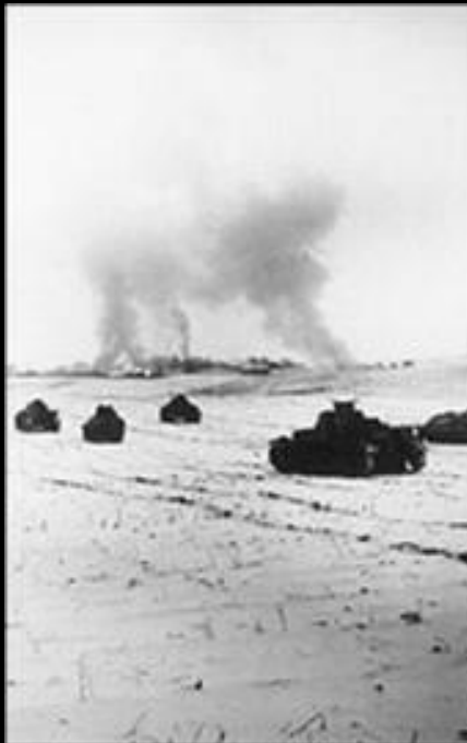
Немецкие танки атакуют советские позиции в районе Истры