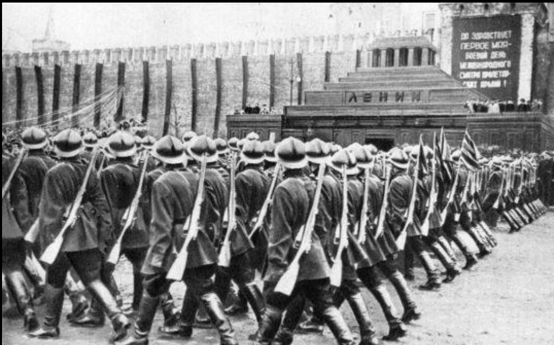
ВТОРОЙ ДЕРЕВЯННЫЙ МАВЗОЛЕЙ. Военный парад.