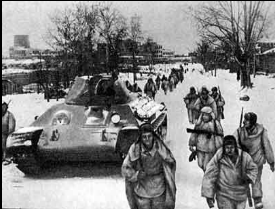
Москва жива, а значит жива вся Русь. Сибиряки - гвардейцы прибыли на защиту столицы