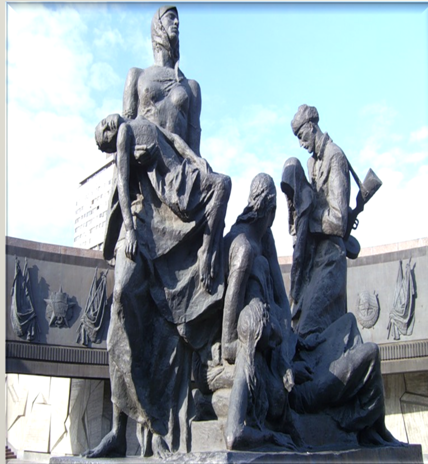
Памятник героическим защитникам блокадного Ленинграда.