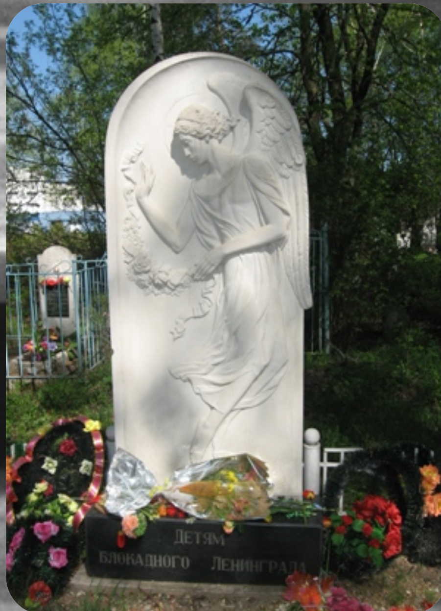
Памятник детям блокадного Ленинграда (Ярославль).