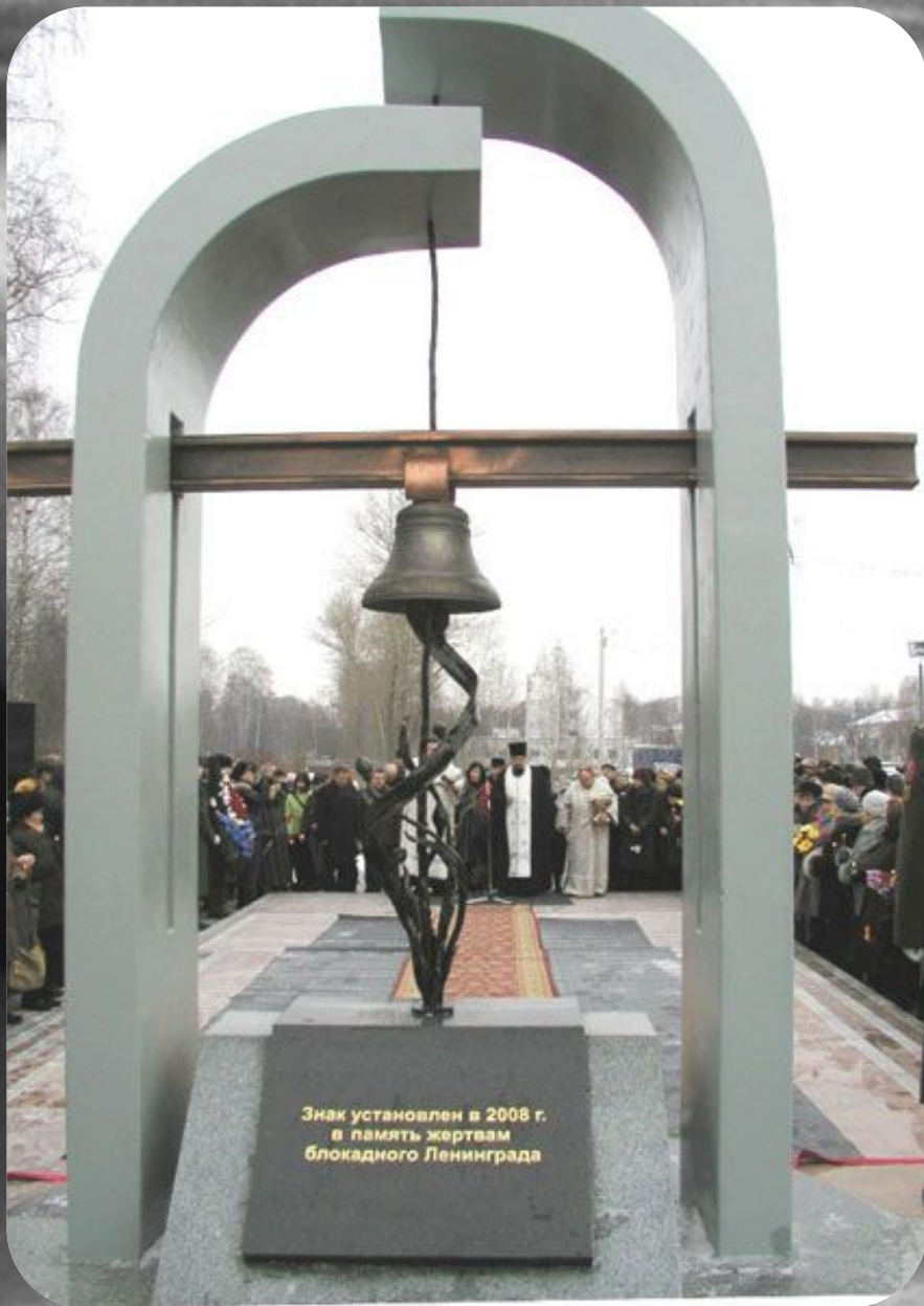
В Ярославле памятник жертвам блокадного Ленинграда.