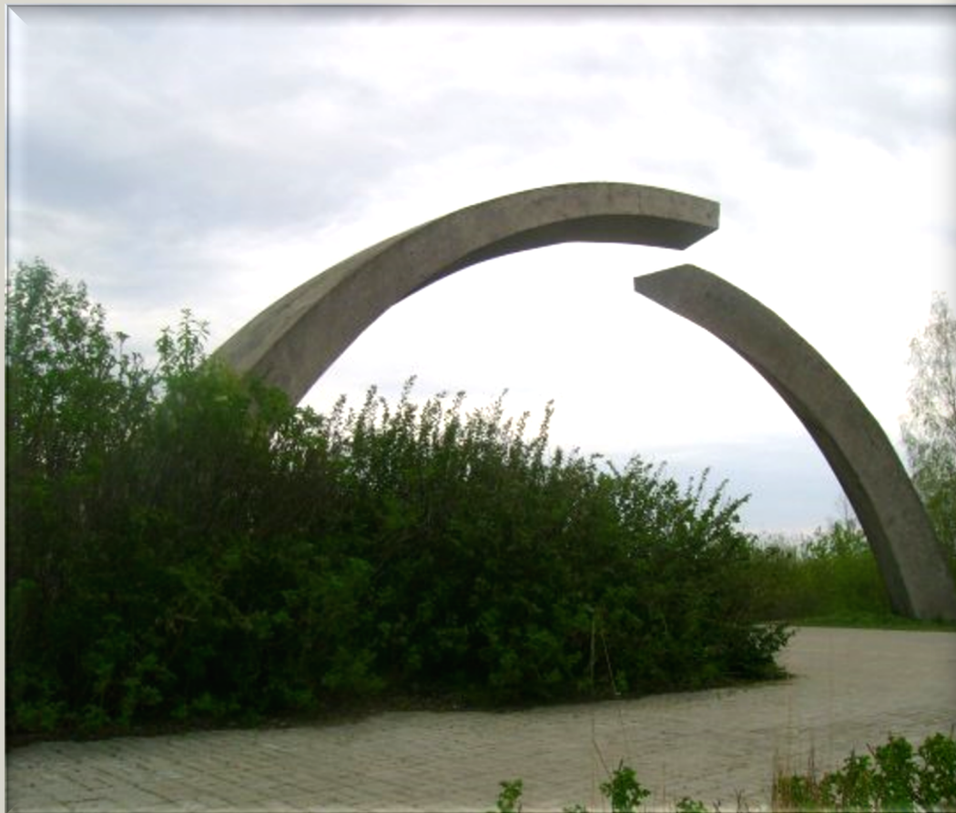
Памятник в честь разрыва блокады Ленинграда!