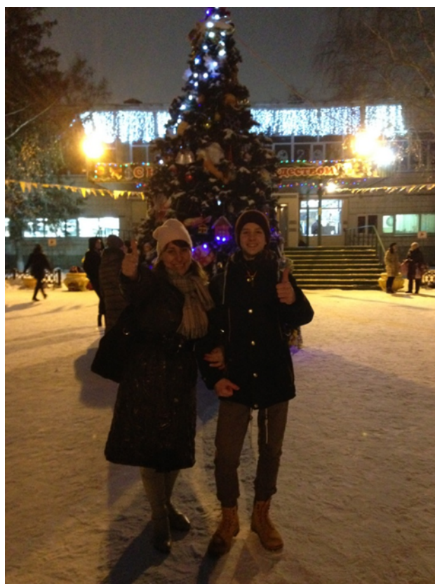
Новый год-2020г., г. Омс