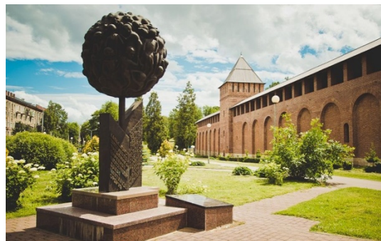
2. «Опаленный цветок» – памятник детям-узникам фашистских лагерей.