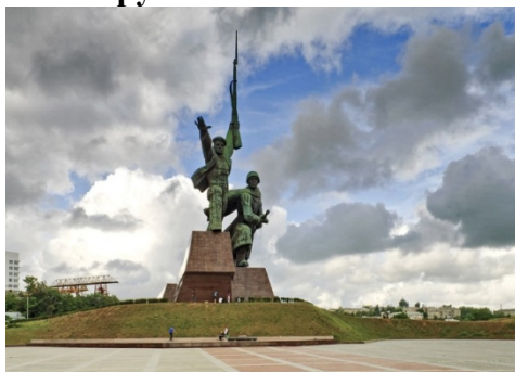
11. Монумент «Солдат и Матрос» на мысе Хрустальный