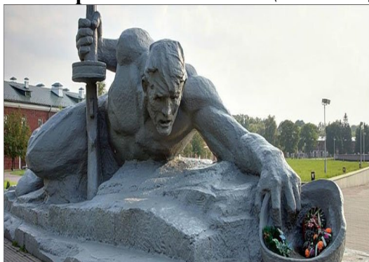
1. Мемориальная композиция «Жажда».