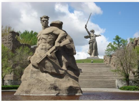
5. Мамаев Курган. Главный монумент ансамбля – 85-ти метровая скульптура Родины-Матери.