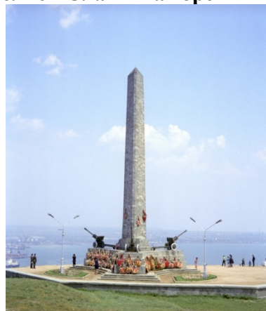
10. Обелиск Славы на горе Митридат