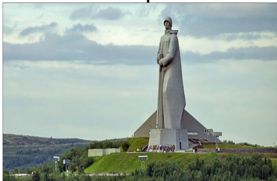
7. Мемориал «Защитникам советского Заполярья».