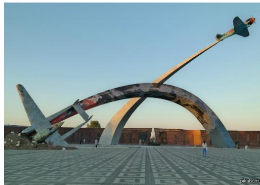
8. Мемориал «Защитникам неба Отечества»